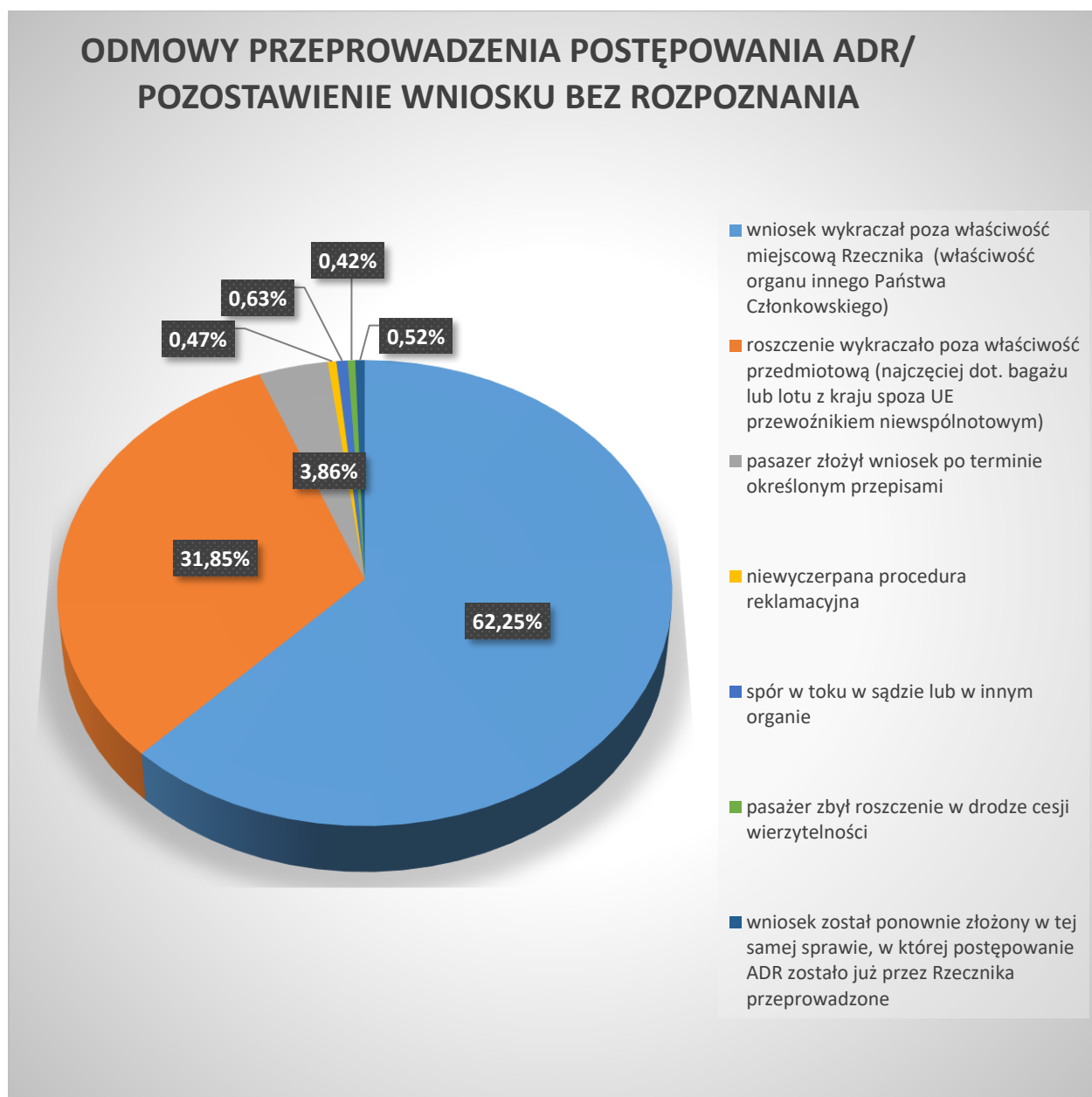
Wykres 4. Przegląd odmowy przeprowadzenia postępowania ADR / pozostawienia wniosku bez rozpoznania

Rzecznik pozostawił wniosek bez rozpoznania / odmówił przeprowadzenia postępowania ADR w przypadku 1915 wniosków, co stanowi 49 % wszystkich wniosków rozpatrzonych w 2023 roku. W 62,25 % z tych przypadków wniosek został złożony do niewłaściwego organu (według podziału właściwości Państw Członkowskich UE zgodnie z rozporządzeniem 261/2004/WE, kompetencje Rzecznika zostały określone w art. 205a ustawy Prawo lotnicze) a w 31,85 % przypadkach przedmiot roszczenia wykraczał poza kompetencje przedmiotowe Rzecznika (głównie dotyczyły bagażu lub zakłóconego lotu rozpoczynanego z państwa spoza UE przewoźnikiem nie wspólnotowym). W 6,21 % przypadkach wniosek został złożony po terminie wymaganym przepisami art. 205a ust. 15 ustawy Prawo lotnicze. Pozostałe przypadki to: w 0,47 % nie została wyczerpana procedura reklamacyjna, w 0,63 % spór był w toku w sądzie lub rozpatrywany przez inny organ, w 0,42 % pasażer zbył wierzytelność w drodze cesji, w 0,52 % wniosek został złożony ponownie w tej samej sprawie, w której postępowanie ADR zostało już zakończone.