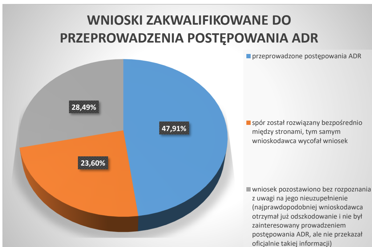
Wykres 2. Wnioski zakwalifikowane do przeprowadzenia postępowania ADR

Do przeprowadzenia postępowania ADR zakwalifikowanych zostało 1987 wniosków (51% wszystkich rozpatrzonych w 2023r. wniosków), z czego w 23,60% (469 spraw) - z reguły po wezwaniu do uzupełnienia wniosku - wnioskodawcy wycofali wnioski przed zawiadomieniem drugiej strony o postępowaniu ADR z powodu wcześniejszego rozwiązania sporu, a w 28,49% (566 spraw) wnioskodawcy po zwróceniu się Rzecznika o uzupełnienie wniosku nie odpowiedzieli, co najprawdopodobniej oznacza, że spór również został już rozwiązany, wnioskodawca otrzymał już odszkodowanie i nie był zainteresowany przeprowadzeniem postępowania ADR, ale oficjalnie nie przekazał takiej informacji. W 47,91% (952 spraw) przeprowadzone zostało postępowanie ADR.